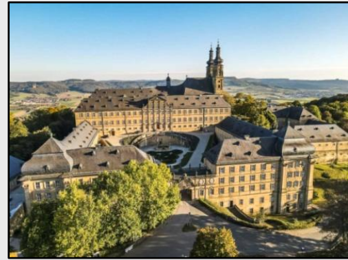
Dawny klasztor w Bad Staffelstein obecnie pełni funkcję centrum edukacyjnego i konferencyjnego fundacji HSS powiązanej z CSU.

4. Infrastruktura i nieruchomości. Fundacje są w posiadaniu szeregu nieruchomości przeznaczonych do realizacji celów statutowych. W Niemczech są to siedziby, biura regionalne oraz centra konferencyjne i szkoleniowe (zob. siedziba główna KAS w Berlinie , siedziba KAS pod Bonn , Akademia KAS , centrum edukacyjne HSS w Bad Staffelstein , budynki nr 1 i nr 2 centrali FES w Berlinie). Zagraniczne oddziały fundacji wynajmują nieruchomości lub posiadają lokale własnościowe (np. Dom KAS w Warszawie ). W niektórych państwach fundacje współpracują z innymi niemieckimi organizacjami, dzieląc lub podnajmując lokale (zob. biura KAS i HSS w German Business Hub w Londynie).